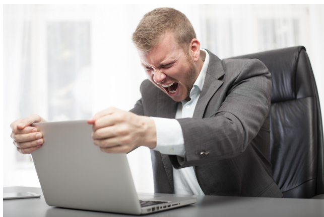
Figura 1: tipica espressione dell'utente appena raggiunto dal surrettizio aggiornamento automatico a Windows 10.

La strategia è la stessa di quella degli spacciatori: prima ti dà la caramellina, poi te la nega sempre più e ti chiede i soldi. Nel frattempo raccoglie dati, ovvio.