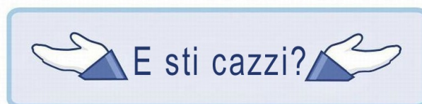
A Te e ad altre 82 persone non frega un cazzo.

Ve lo posso dire anche tramite l'iconografia facebookiana, se volete: