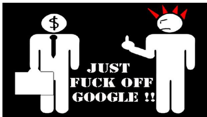
Figura 4: il messaggio finale per Google.

Spero di essere stato abbastanza chiaro.