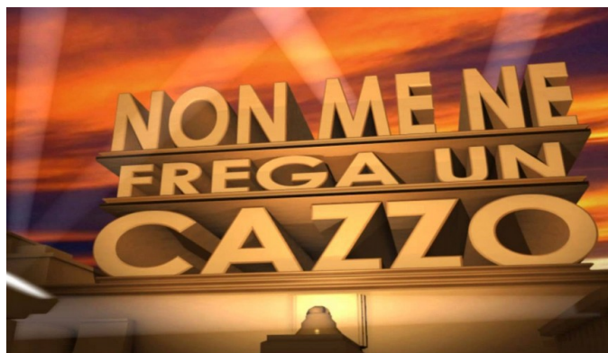
Figura 2: una delle possibili risposte all'email di Google.

Se non fosse abbastanza chiaro, facciamo che ve lo suono anche: