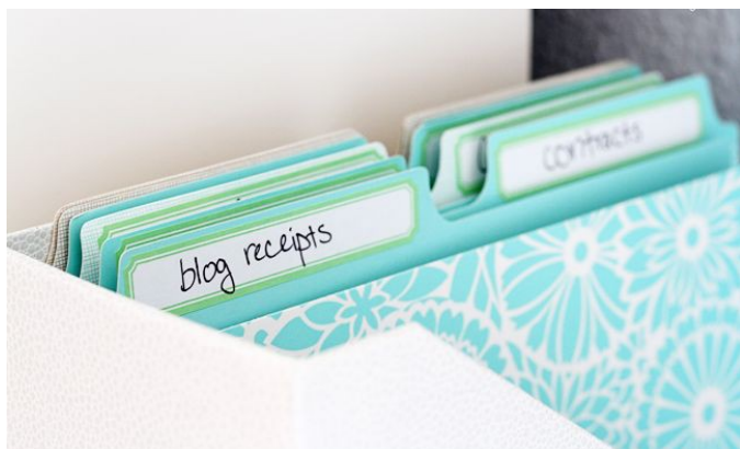
Figura 1: come per i materiali cartacei, anche nel browser i segnalibri vanno gestiti con ordine, altrimenti perdono di utilità.

Avete un segnalibro che sapete di avere. Lo cercate in gestione segnalibri. Ve lo trova, ma non vi dice in quale cartella si trova. Bestemmiate. Ora però non più.