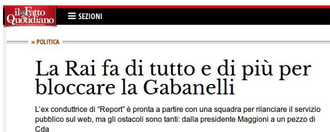
Il titolo del Fatto Quotidiano.

Doveva essere tutto già operativo, ma Rai24, la testata Web diretta dalla giornalista icona di Report, è ancora ai box: dà fastidio prima ancora di cominciare.